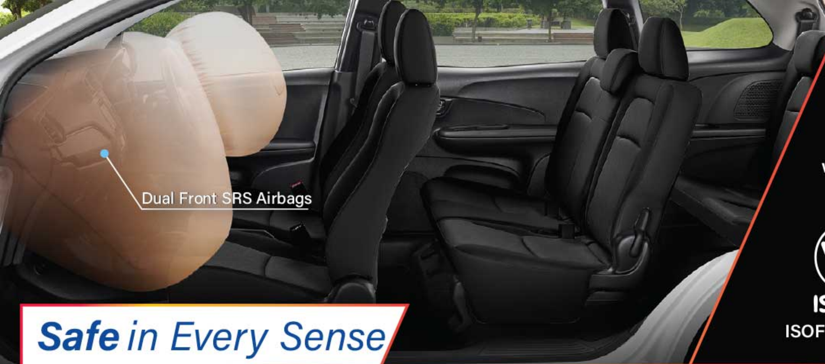
Dual Front SRS Airbags