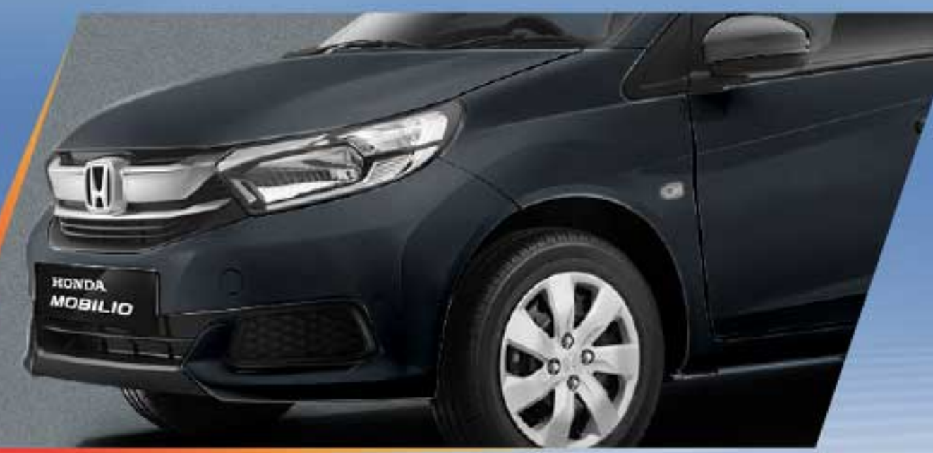
Meteoroid Gray Metallic