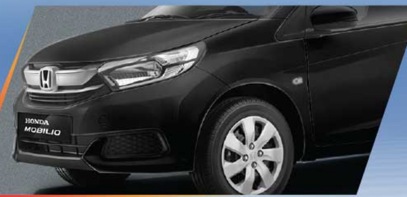
Crystal Black Pearl